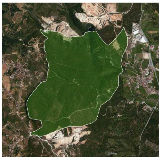
Baldios da Serra de Ota - montagem de José Carlos Morais